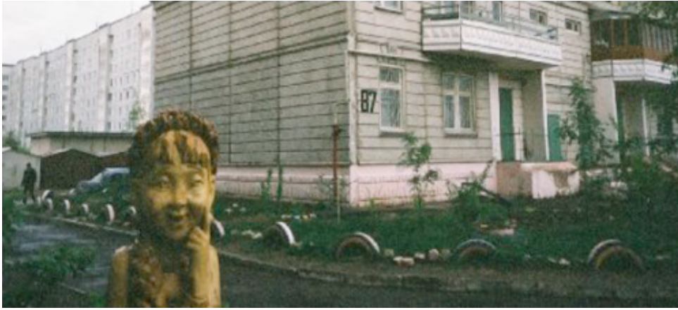
« Tver, au nord-est de Moscou, un sourire en bois », © N. Blanc, mai 2005.

L'environnement esthétique participe de la réussite d'une éthique.