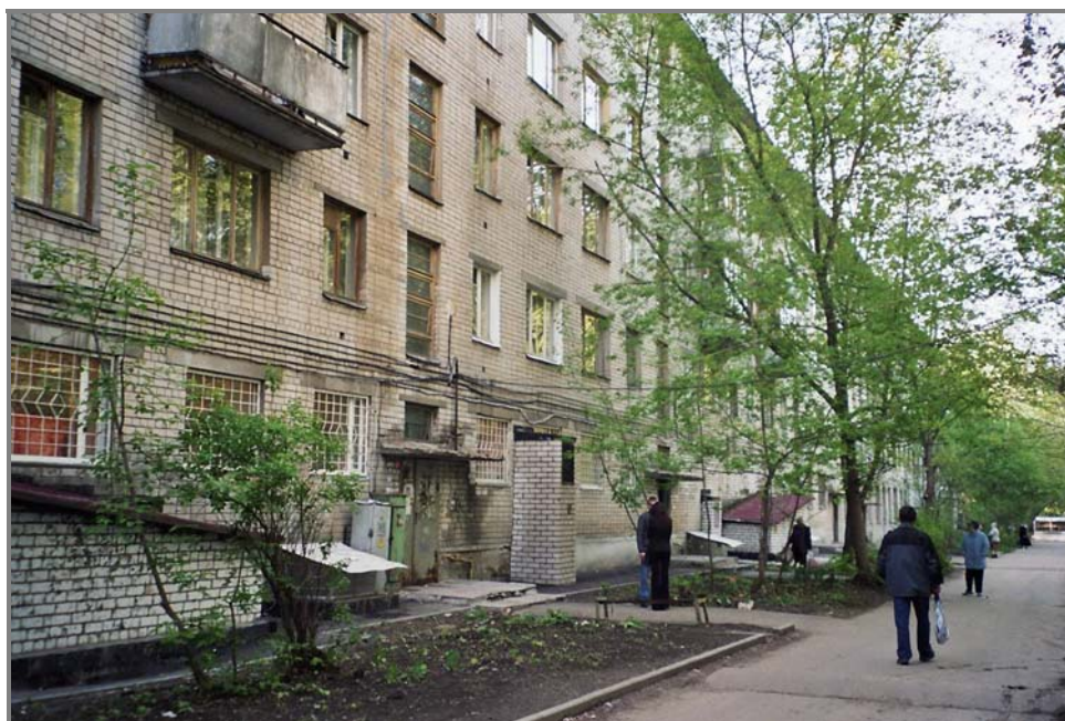
Photo 2 Patrimoine khrouchtchévien