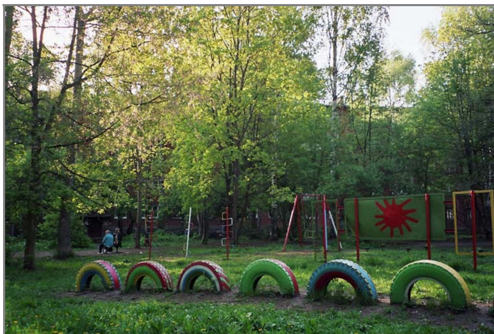
Photo 3 La cour aménagée par ses habitants